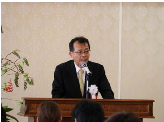
右城会長による式辞