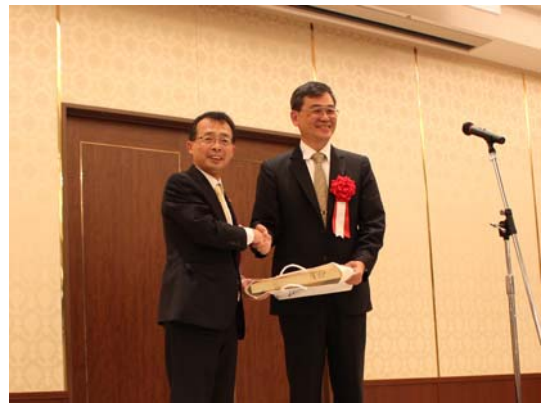
王先生へプレゼント