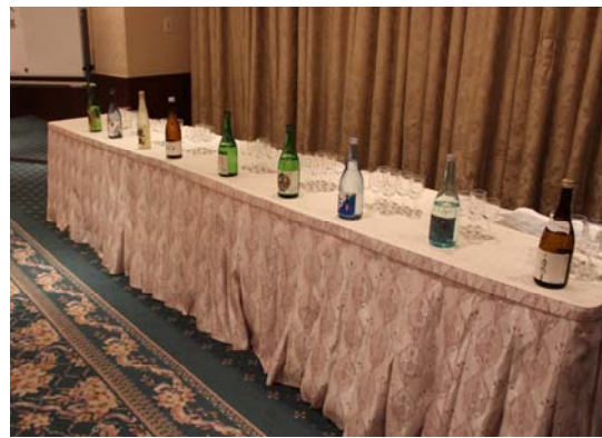
高知の地酒コーナー