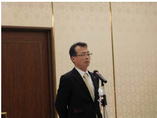
右城会長による挨拶