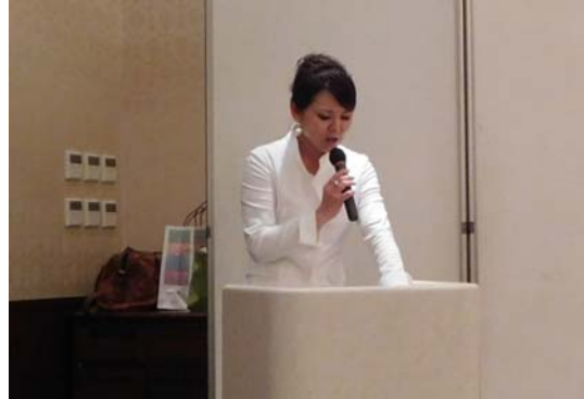
河野氏による司会進行