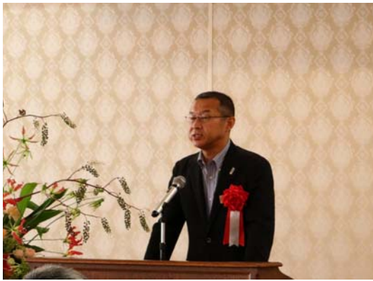
福田部長による祝辞