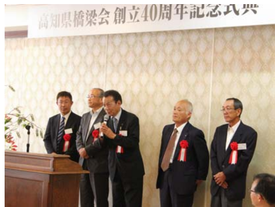
理事OBによる近況報告