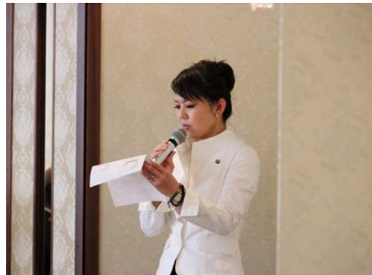
河野氏による司会進行