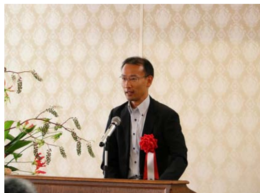
新宅所長による祝辞