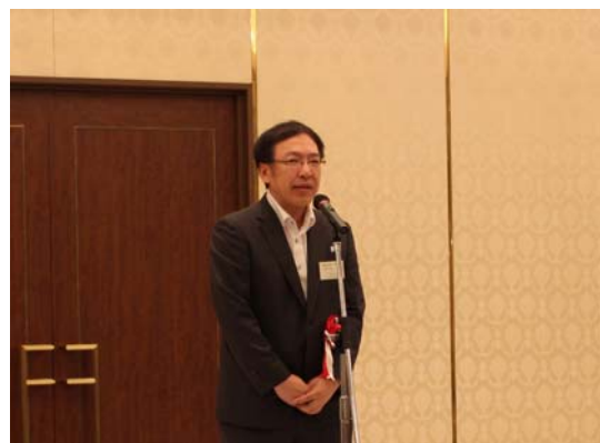
栗山参事氏による来賓挨拶