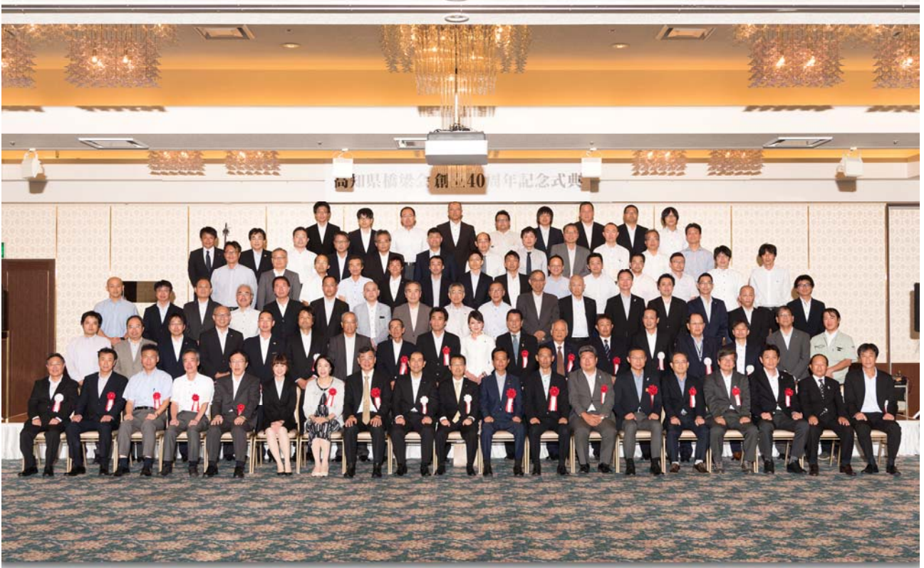
高知県橋梁会 創立40周年記念式典 平成29年8月28日 サンピアシリーズ