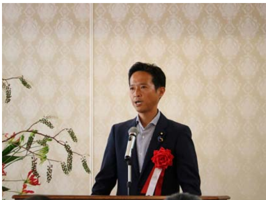
高野議員による祝辞